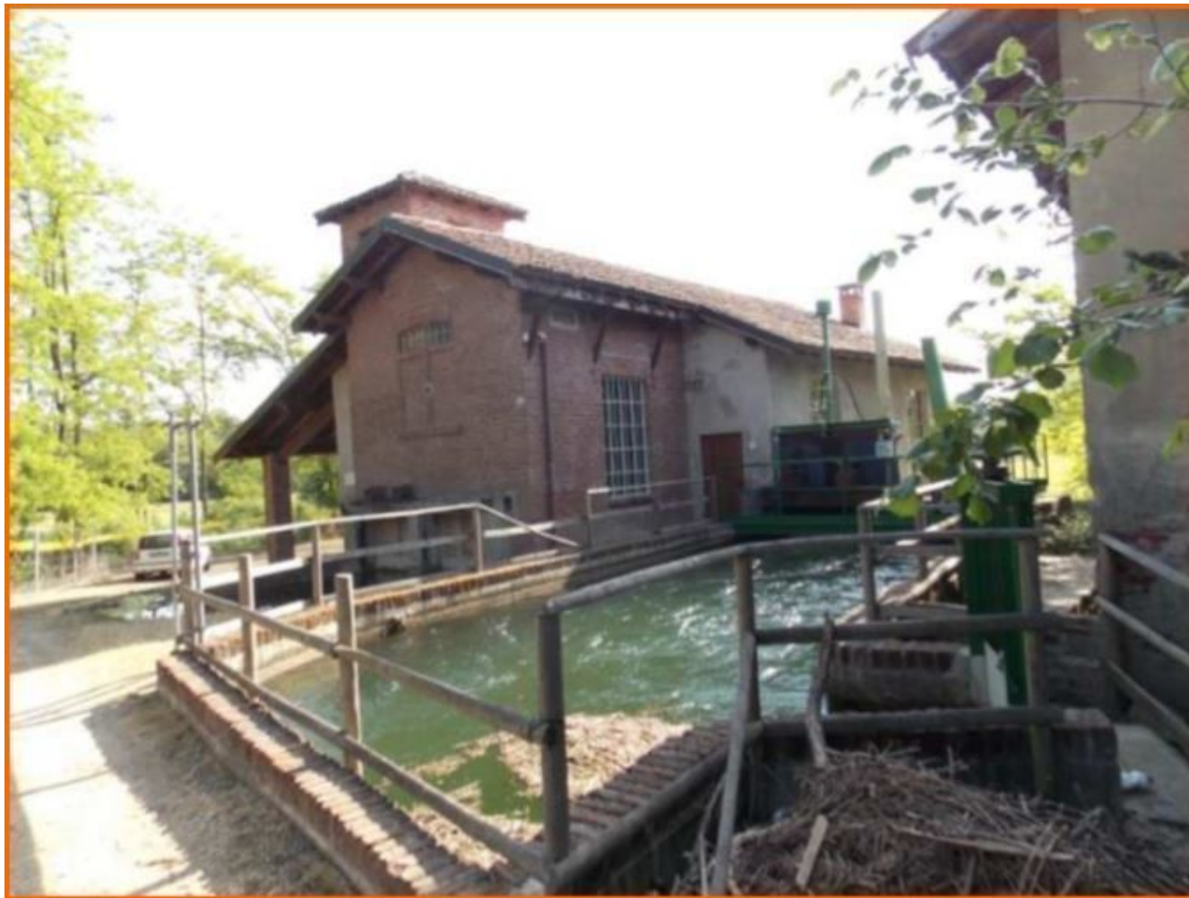
Figura 1: Mulino in cui era stata ricavata la centrale idroelettrica