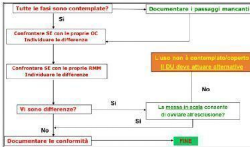
Figura 1: Verifica dello scenario di esposizione ricevuto

Nel caso in cui l'uso non sia compreso nello scenario di esposizione, si possono profilare le seguenti possibilità: