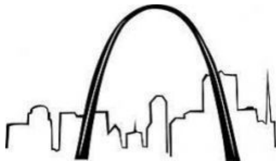
Presentazione stilizzata dell'arco costruito a Saint Louis nel Missouri.

Due buoni esempi in proposito sono l'arco di Saint Louis e le figura di Muller-Lyer.