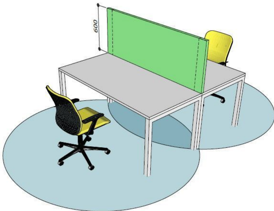
Figura 5 - Scrivanie da 1600 mm affiancate sul lato lungo - posizione seduta

Si raccomanda poi "l'adozione di uno schermo di altezza indicativa, a partire da quella del piano di lavoro, di (800 ±20) mm, quando sia prevedibile la presenza prolungata di altre persone (per es. visitatori) in piedi".