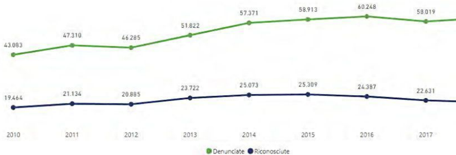
Figura 31 – Malattie professionali protocollate in Italia negli anni 2010-2018

Torniamo a parlare di riconoscimento delle malattie professionali riprendendo dal Rapporto un dato percentuale: