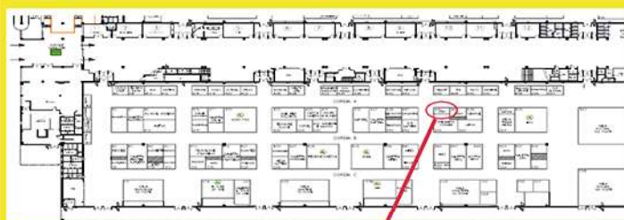
Padiglione B - Stand: A45

Il pagamento della quota d'ingresso ad Ambiente Lavoro Convention consente di partecipare a tutti i convegni e seminari che ne compongono il programma e quindi anche alle nostre iniziative, compatibilmente con la disponibilità dei posti in sala. E' possibile acquistare on line sul sito di Ambiente Lavoro Convention, il biglietto per l'accesso alla manifestazione ad una tariffa scontata del 35% per iscrizioni fatte entro il 15 luglio p.v. Per maggiori e più dettagliate informazioni consultare il sito www.ambientelavoro.it