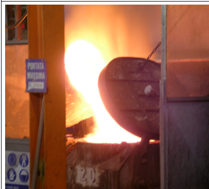
Fig4: trasferimento a carrello