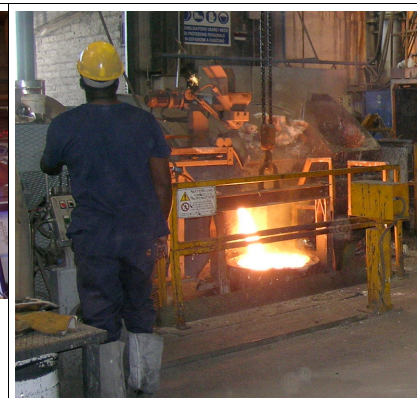
Fig3: prelievo da avanforno