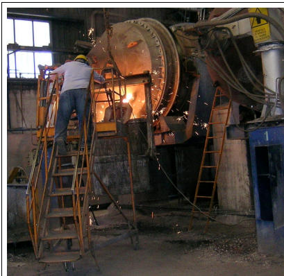
Fig1: prelievo da rotativo