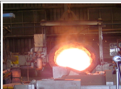
Fig2: trasferimento ad avanforno