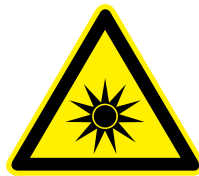
Figura 6 - Segnaletica Pericolo Emissione Radiazioni Ottiche Artificiali

Il personale addetto ai processi di fusione e coloro i quali abbiano comunque accesso alle zone ove è presente il rischio ROA dovrà indossare specifici DPI per infrarossi individuati secondo i criteri stabiliti nel precedente paragrafo.